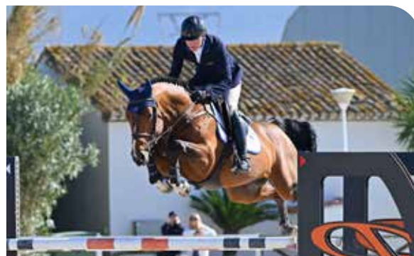
FARZACK DES ABBAYES Montender x Flipper D'Elle