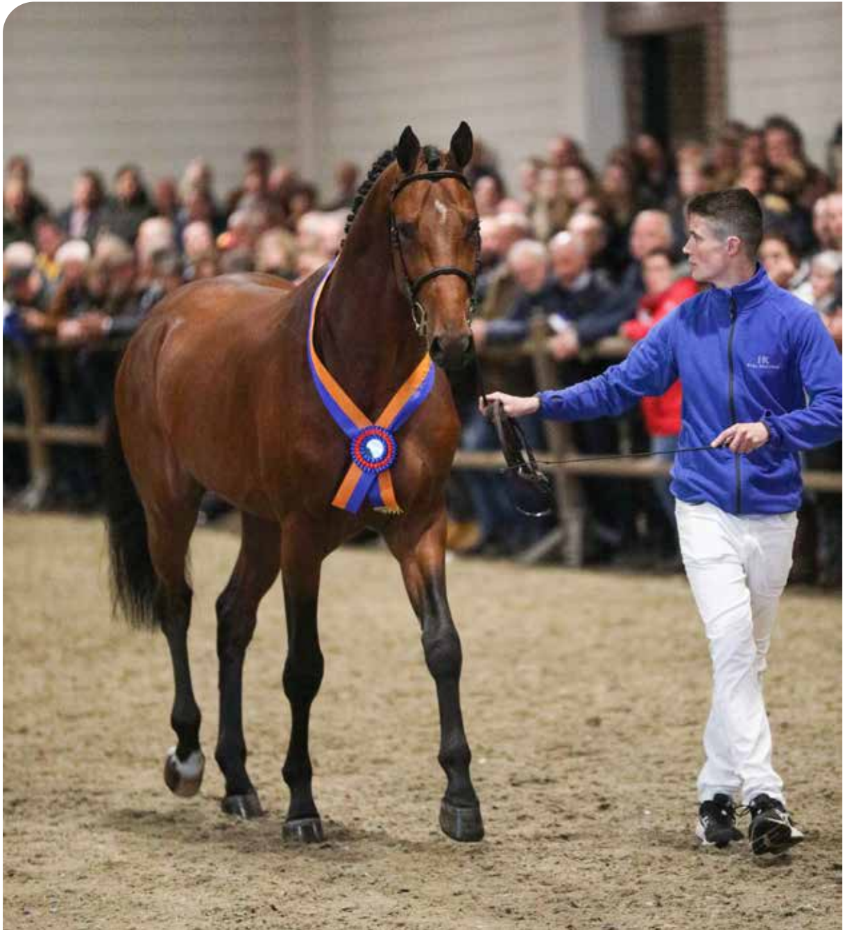
Opus One JDV - KWPN Premium stallion 2022