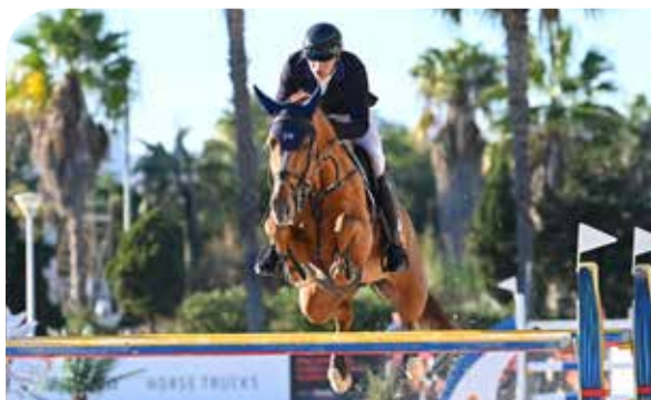
ENTERTAINER Warrant x Corland