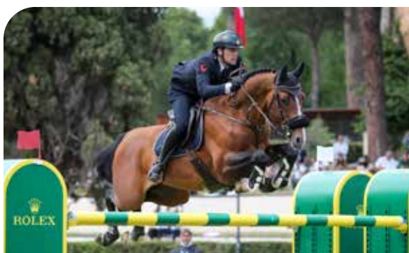
GASPAHR Berlin x Tangelo van de Zuuthoeve