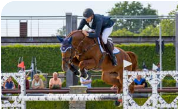
LAMBRUSCO Entertainer x Lux Z