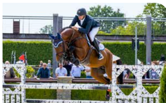
LAMBADA SHAKE AG Aganix du Seigneur x Spartacus