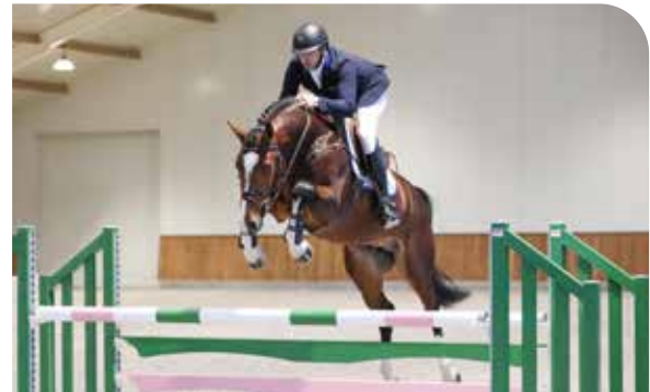
NEWMARKET VM Chacoon Blue x Numero Uno