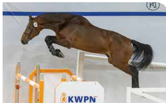
OPUS ONE JDV Cape Coral RBF Z x Cardento