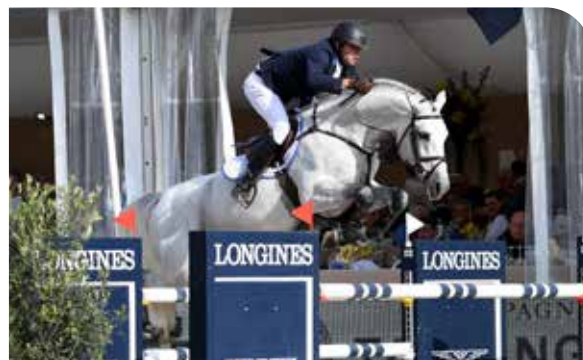
CAPE CORAL RBF Z Cornet Obolensky x Argentinus