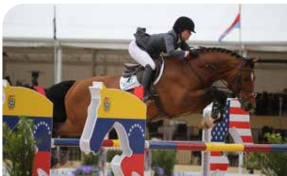
BUSTIQUE Indoctro x Grannus