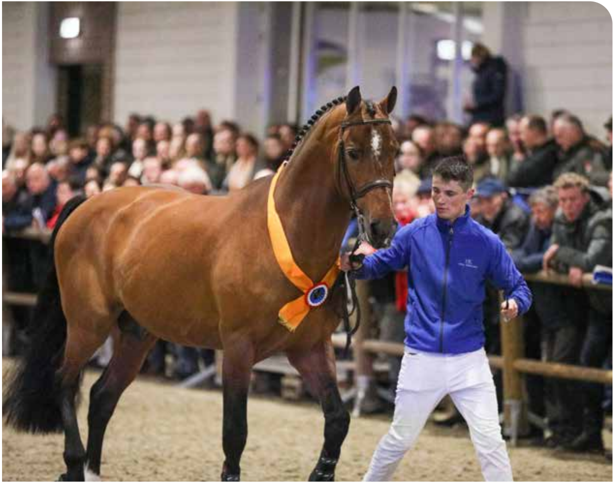
Bustique - KWPN "keur" predicate stallion