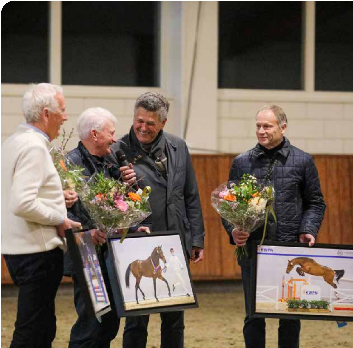
Breeders awards - Cape Coral RBF Z