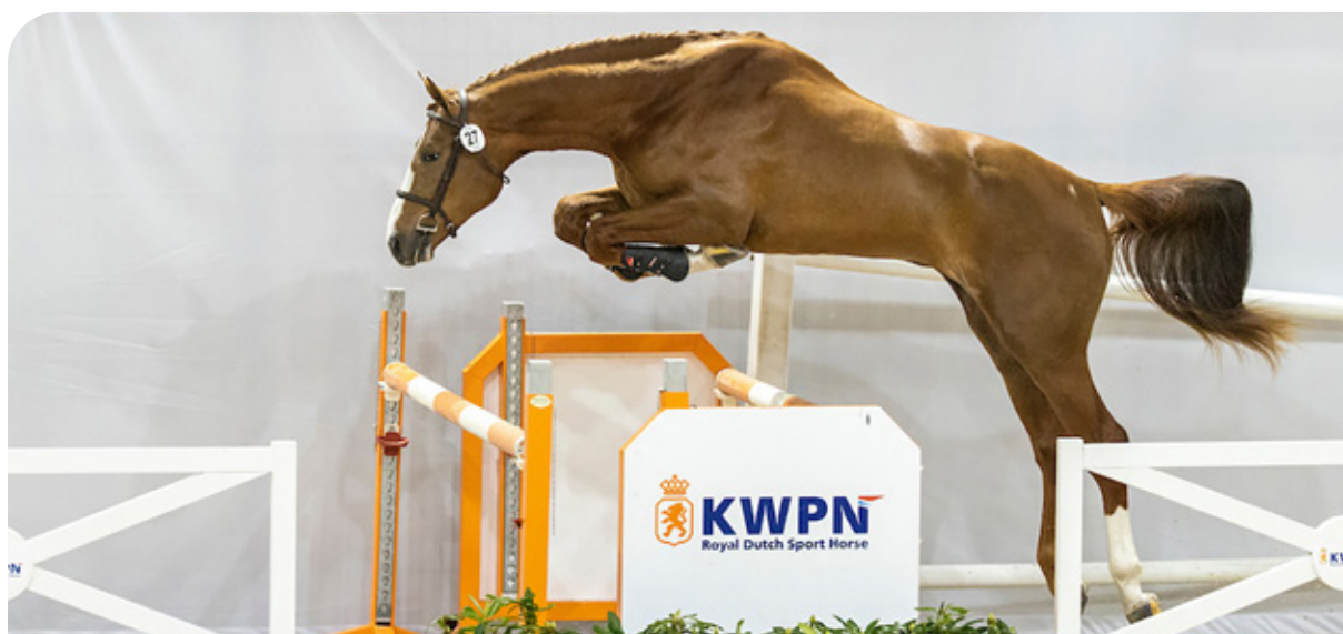
Oral JDV (Cape Coral RBF Z x Lamm de Fetan)