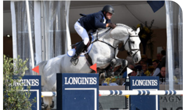
CAPE CORAL RBF Z Cornet Obolensky x Argentinus