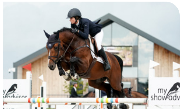
FARZACK DES ABBAYES Montender x Flipper D'Elle