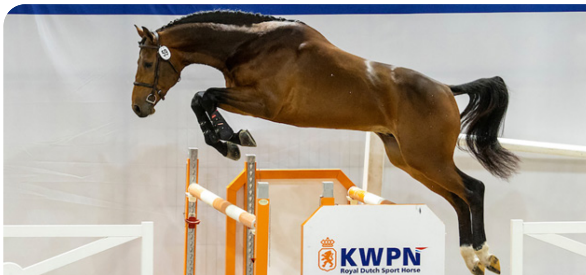
Corvette ZG Z (Cornet Obolensky x Diamant de Semilly)