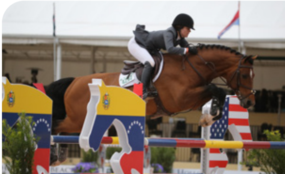
BUSTIQUE Indoctro x Grannus