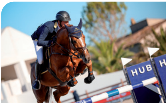
ENTERTAINER Warrant x Corland